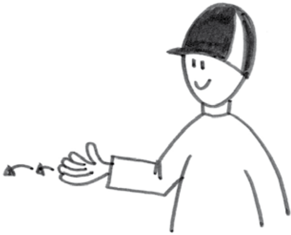
KIITOS / OLE HYVÄ