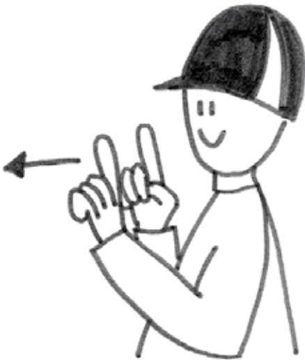
SEURATA / MUKANA