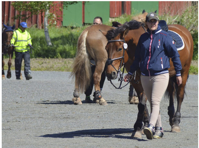
Kannen kuvat