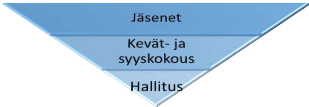
Kuva 1. Päätösvalta yhdistyksessä.

Seuran jäsenillä on ylin päätösvalta. Jäsenet pystyvät käyttämään tätä päätösvaltaansa seuran yleiskokouksissa, eli kevät- ja syyskokouksissa. Syyskokous valitsee hallituksen ja määrittää toimintasuunnitelman ja talousarvion, joita hallitus toteuttaa. Kevätkokouksessa hyväksytään edellisen toimintavuoden toimintakertomus ja tilinpäätös sekä annetaan hallitukselle vastuuvapaus. Jokaisella jäsenellä on ääni- ja puheoikeus yleiskokouksissa.