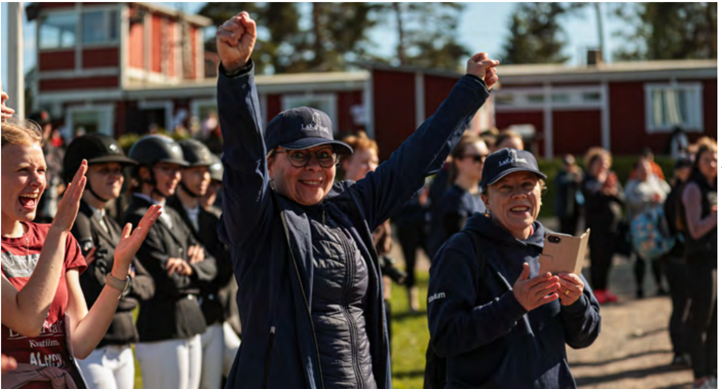
RATSASTUSKOULUOPPILAIDEN MESTARUUDET.