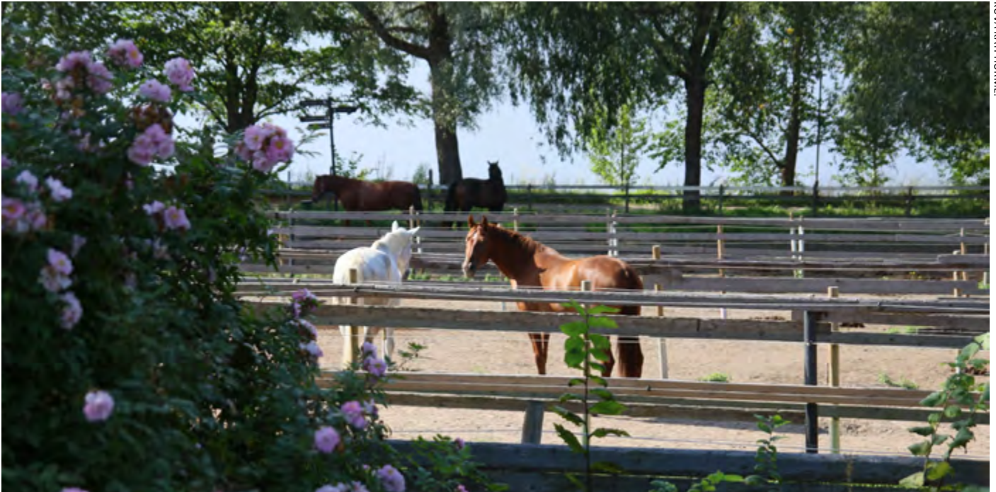
KUVA KATI HURME