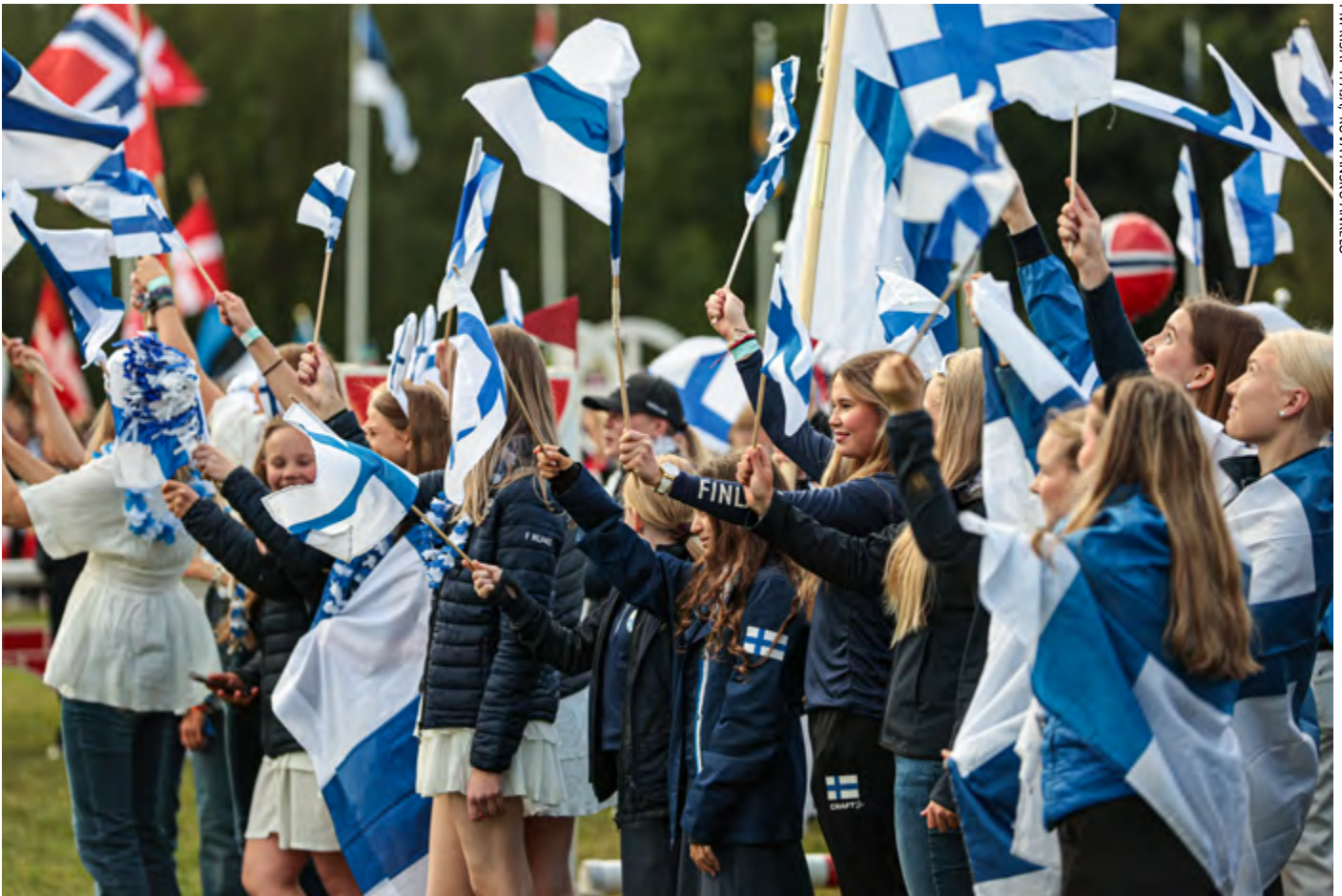
PM-KISAT VÄLÄ