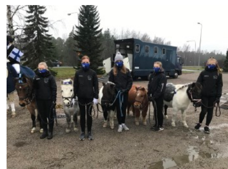
Lähdepellon Ratsastuskoulun ponit ihastuttivat kaikenikäisiä katsojia.