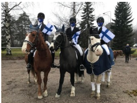
Suomen liput liehuivat itsenäisyyspäivän kunniaksi