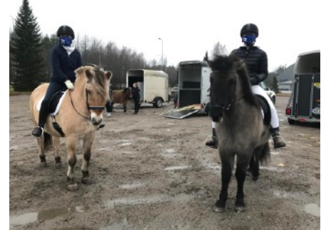
Kulkueessa oli mukana useita eritotuisia poneja ja hevosia