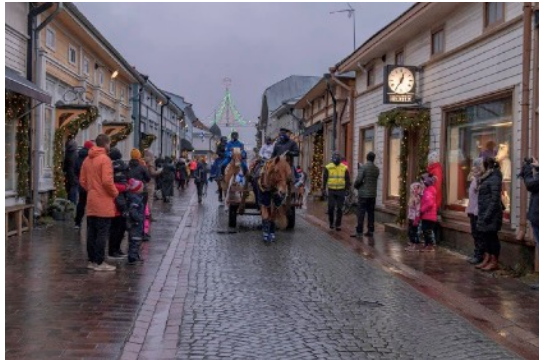
Kulkue Vanhassa Raumassa