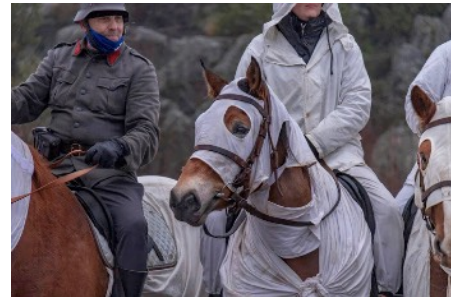
Niinisalon hevoset olivat vaikuttavia lumipuvuissa